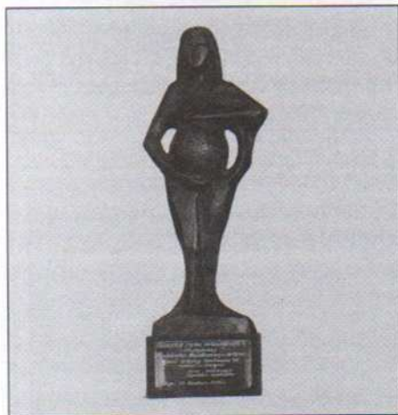
Statuetka „Matka Ziemia”

Po wyzwoleniu w maju 1945 roku dotarła z ręcznym bagażem do Olsztyna. Zamieszkała przy ul. Wyzwolenia, a w 1981 roku przeniosła się do nowego mieszkania w Kortowie. Przez wiele lat zajmowała się handlem — była współwłaścicielką kiosku z odzieżą roboczą. Wychowała córkę, ma jedną wnuczkę.